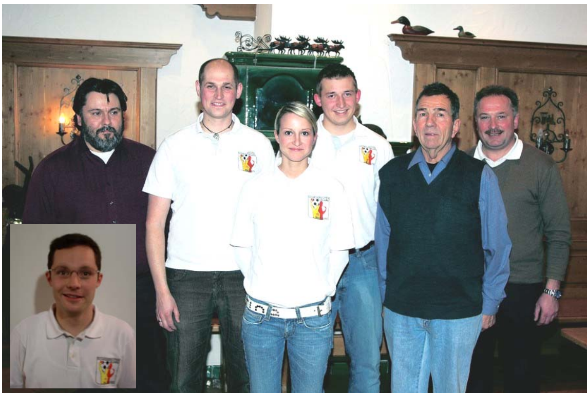
der neue Ausschuss